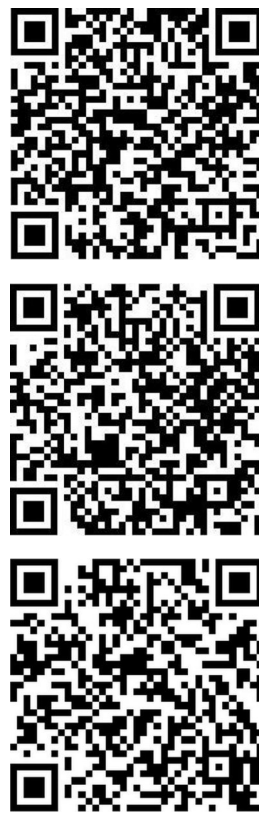
扫描二维码,观看配文视频

PORT取出后,查看装置是否完整,皮下隧道开口处“8”字缝合,静脉穿刺处压迫5 min;清除注射座周围的纤维包膜组织,严密止血,缝合皮下组织和皮肤,无菌敷料覆盖手术切口。